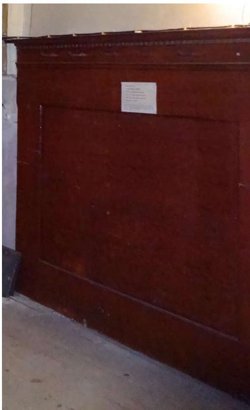
Jižní stěna – TR/12.1