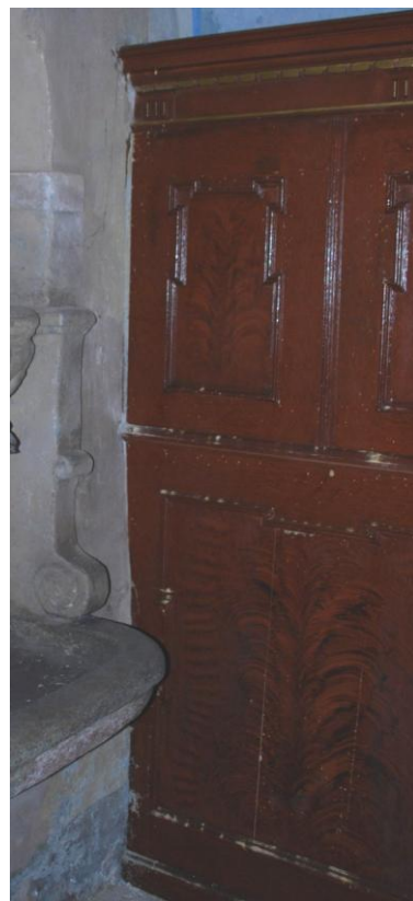
Severní stěna – detail, TR/12.2