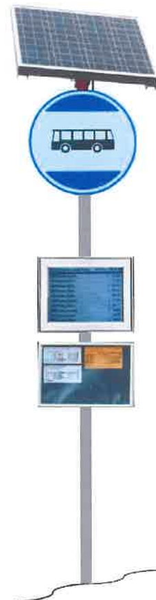
Vizualizace možné konstrukce označnicku