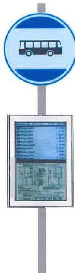
Vizualizace možné konstrukce označníku