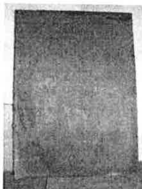
obraz závěsný – Klanění sv. Tří králů, olej na plátně, rozm. 196x143 cm, rám chybí

Obraz zařazen do souboru obrazů, které jsou součástí historických uměleckých sbírek z kláštera minoritů v České Krumlově