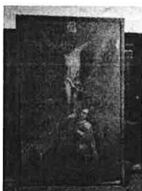
obraz závěsný – Ukřižování, olej na plátně, rozm. 230x140 cm, lišt. rám rozm. 241x151 cm

Obraz zařazen do souboru obrazů, které jsou součástí historických uměleckých sbírek z kláštera minoritů v České Krumlově