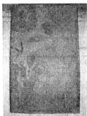
obraz závěsný – sv. Robert Belarminus, olej na plátně, rozm. 162x115 cm, lišt. rám. rozm. 175x122 cm

Obraz zařazen do souboru obrazů, které jsou součástí historických uměleckých sbírek z kláštera minoritů v České Krumlově