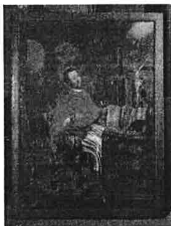
obraz závěsný – světec – kardinál, olej na plátně, rozm. 217x133 cm, původní rám chybí

Obraz zařazen do souboru obrazů, které jsou součástí historických uměleckých sbírek z kláštera minoritů v České Krumlově