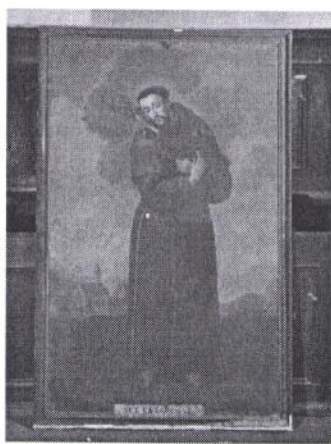
obraz závěsný – sv. František z Assisi, olej na plátně, rozm. 204x132 cm, rám rozm 220x148 cm (protějškový k obrazu sv. Kláry)

Obraz zařazen do souboru obrazů, které jsou součástí historických uměleckých sbírek z kláštera minoritů v České Krumlově